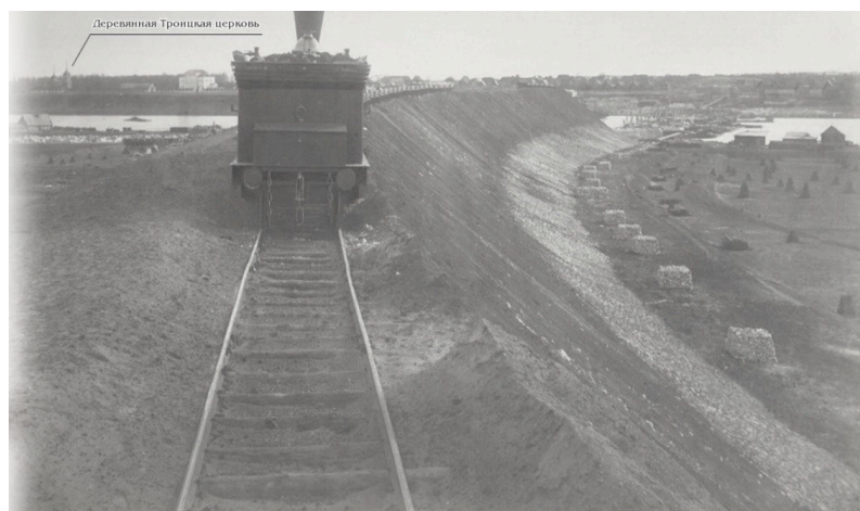
Старая деревянная Троицкая Церковь в Щурово (фото строительства моста через р.Ока, 1864 г.)